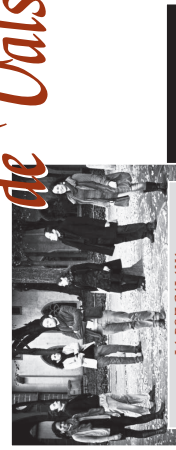
LA BOZ GALAMA