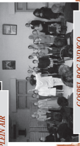
GOSPEL BOG INDIGO