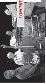
CONCERTO POUR CHANSONS