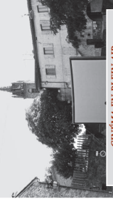
CINÉMA EN PLEIN AIR