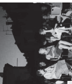
FILM DOCUMENTAIRE "Hors les murs"